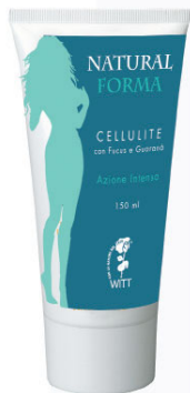
PE78 Tubo 150 ml

Naturalforma CELLULITE ha un'azione termogenica che si manifesta con una sensazione di calore che può provocare un arrossamento temporaneo nelle pelli delicate. Applicata 2-3 volte al giorno può dare risultati visibili in 4-6 settimane. Utilizzata in abbinamento a DRINK e DRENA e coadiuvata da una dieta ipocalorica e da esercizio fisico, i risultati potranno essere molto più rapidi.