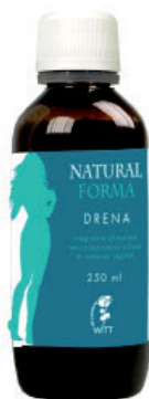
AL69 Flacone 250 ml

suo gradevole sapore è utile per chi non riesce a bere la giusta quantità di acqua, aiutandolo a ripristinare l'equilibrio idrico. La forte azione di DRENA è dovuta alla presenza di tarassaco, peduncoli di ciliegio, ananas, equiseto, the verde, cardo mariano e altre piante che agiscono sul fegato e sull'apparato urinario, per mantenerne la loro buona funzionalità fisiologica.